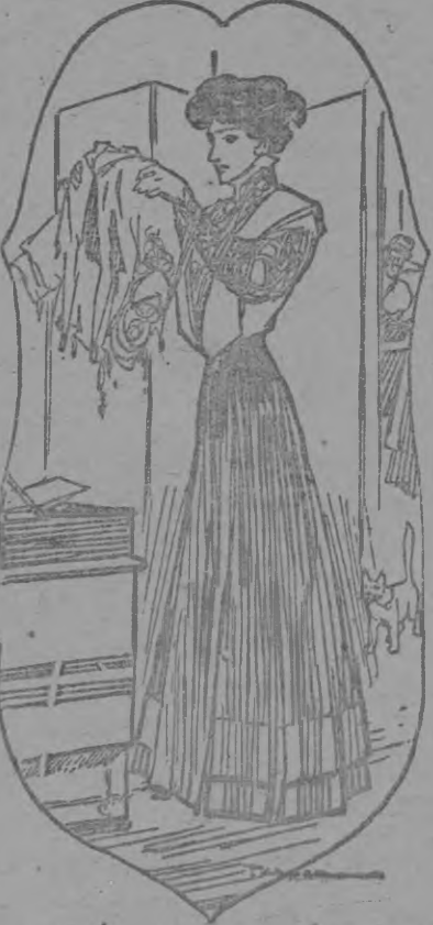
PULLED TO PIECES.

She began by making a specialty of lingerie waists. These she washed in